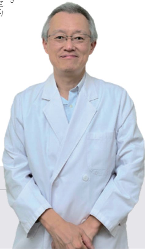
リハビリテーション科部長

予防」が今後のライフワークとなりました。骨折予防には、整形外科医だけでなく、看護師、リハビリ