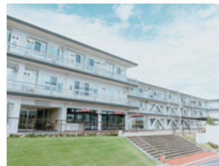
▲グルッポふじとう