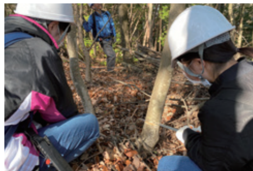
▲森づくりボランティアの様子

—— 高蔵寺の一番の魅力を教えてください。 高蔵寺の一番の魅力は、地域のために活発に活動している方が多いことだと思っています。 私自身、近年の間でこの地域出身の様々な世代の方の活動が増えてきていると実感しています。 ICONIC MARKETなど地域の方々中心に行っているイベントが高蔵寺には多く、中には弊社が小規模から始めたイベントを引き継いで行っていたイベントもあり、地域のために活動している方々の手で運営されています。