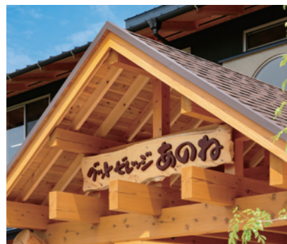
▲木の看板がステキです!