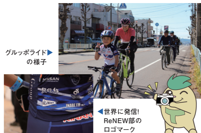
グルッポライドの様子

ロゴマークが完成してすぐに、「自転車を活用した高蔵寺ニュータウンの魅力発信に関する協定」を締結し、協働でさまざまな取り組みを行っているアジアトップレベルの自転車ロードレースチーム「キナンレーシングチーム」のユニフォームに採用されました。世界で「ReNEW部KOZOJI」の入ったユニフォームを着た選手が走っていると考えると、とても感動したことを覚えていきます。 また、キナンレーシングチームと一緒に月に2回ほどサイクリングイベント「グルッポライド」を行っています。遠方から若い年代の方も参加してくれるので、イベントを通してこのまちの魅力を体感していただくきっかけをつくれたいと思います。