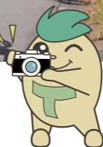
▲世界に発信! ReNEW部のロゴマーク