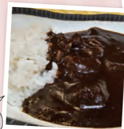
ブラックカレーソース 450円