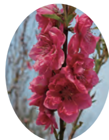
今年のハナモモまつりの様子